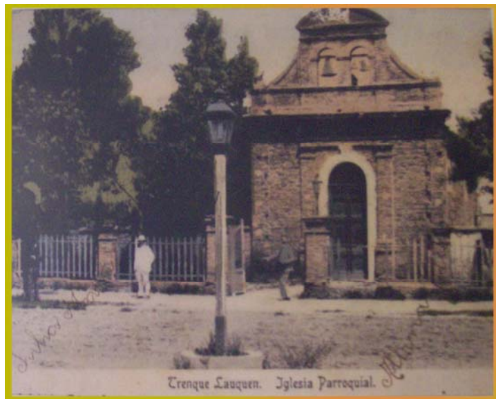
Trenque Lauquen Iglesia Parroquial

entonces una segunda Comisión Pro Templo; el 29 de octubre de 1911 se colocó la piedra fundamental que daría lugar a la iglesia que, con escasa variación es la que hoy conocemos y que reconoce como Patrona a Nuestra Señora de los Dolores.